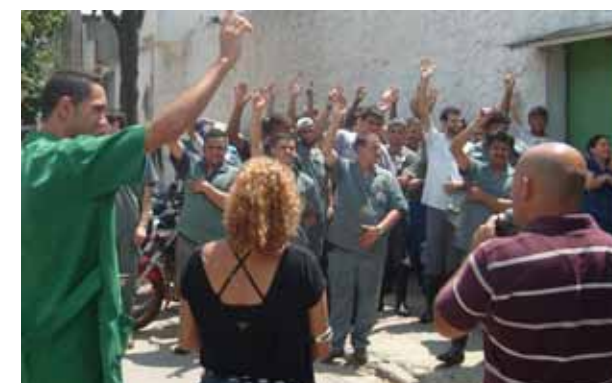
Na Plasmel, os companheiros aprovaram reajuste de 8,5%