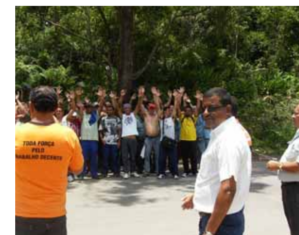
Trabalhadores pararam 2 dias para conseguir aumento

Após dois dias de paralisação (dias 18 e 19 de novembro), os trabalhadores da