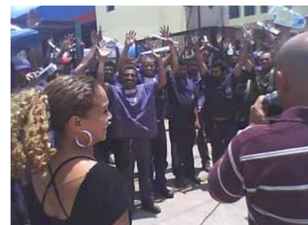
Os 110 companheiros da Tanesfil aprovaram reajuste de 7,5%

A assembleia na Plasmel foi realizada no dia 18 de novembro e os companheiros aprovaram por unanimidade o reajuste de 8,5% a partir do dia 1º de janeiro de 2010 e 25% de abono.