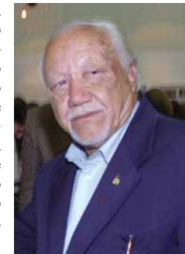
Braz se dedicava à pesquisa da memória do ABC e era membro ativo do Gipem

va à pesquisa da memória do ABC e era membro ativo do Gipem (Grupo Independente de Pesquisadores da Memória do Grande ABC). O corpo foi velado no Sindicato dos Metalúrgicos de Santo André e cremado no Cemitério de Vila Alpina, zona Leste da Capital.