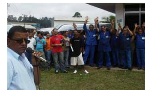
Trabalhadores receberam 7% de reajuste salarial

Eles também conseguiram convênio farmácia. A empresa também criou um prêmio de R$ 400 que será sorteado entre os trabalhadores que não tiverem nenhuma falta no mês.