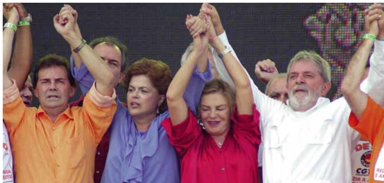
Paulinho, Dilma, dona Marisa e Lula cantando o Hino Nacional para 1,5 milhão de trabalhadores

Mais de um milhão de trabalhadores participaram da tradicional festa do 1º de Maio da Força Sindical. Neste ano, a bandeira da mobilização foi a redução da jornada para 40 horas semanais, sem redução de salário. O evento contou com a presença do presidente Lula, a ex-ministra Dilma Rousseff e outras autoridades.