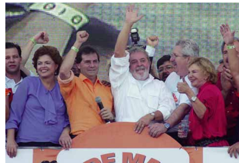
Dilma Rousseff, pré candidata à Presidência, Paulinho da Força, o presidente Lula e sua mulher Marisa

O evento terminou às 19 horas e teve 30 atrações musicais e sorteio de 19 carros 0km e um apartamento.