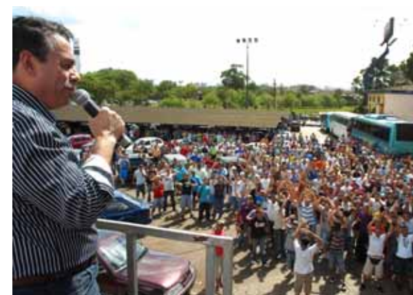
Sindicato se reunirá com os diretores da empresa para negociar melhorias