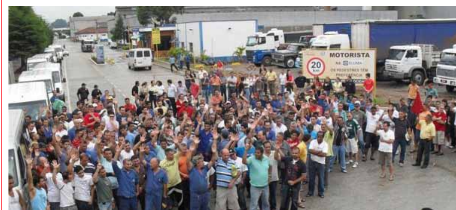
Companheiros da Eluma Utinga durante aprovação da proposta negociada pelo Sindicato

Depois de uma greve de dois dias, iniciada no dia 20 de janeiro contra a demissão de 69 trabalhadores, os 1.200 companheiros da Eluma decidiram voltar ao trabalho, em assembleia realizada na tarde de 22 de janeiro, aceitando a proposta negociada pelo Sindicato com a empresa. Em reunião na noite de 21 de janeiro, o Sindicato cobrou da direção da empresa explicações para a demissão de 69 trabalhadores demitidos, companheiros com doenças ocupacionais, que tinham sofrido acidente de trabalho ou que estavam a 12 meses para se aposentar. A greve havia sido decretada pelos trabalhadores no dia 20 de janeiro, em assembleia, até que a empresa negociasse as demissões.