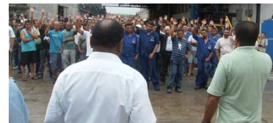
Os trabalhadores da unidade Capuava também aceitam o acordo

Depois de uma greve de dois dias, iniciada no dia 20 de janeiro contra a demissão de 69 trabalhadores, os 1.200 companheiros da Eluma decidiram voltar ao trabalho, em assembleia realizada na tarde de 22 de janeiro, aceitando a proposta negociada pelo Sindicato com a empresa. Em reunião na noite de 21 de janeiro, o Sindicato cobrou da direção da empresa explicações para a demissão de 69 trabalhadores demitidos, companheiros com doenças ocupacionais, que tinham sofrido acidente de trabalho ou que estavam a 12 meses para se aposentar. A greve havia sido decretada pelos trabalhadores no dia 20 de janeiro, em assembleia, até que a empresa negociasse as demissões.