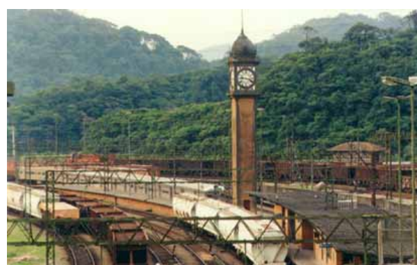
Patío Ferroviário, com destaque para a torre do relógio