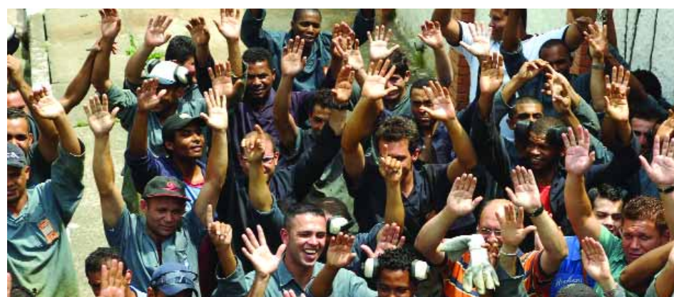
Companheiros da Fogal aprovam Campanha Salarial 2009

Faça igual aos companheiros dessa empresa. Reivindique e mobilize-se pelos seus direitos. O Sindicato entrará em contato para realizar negociação, caso a empresa não queira negociar, o caminho será a paralisação.