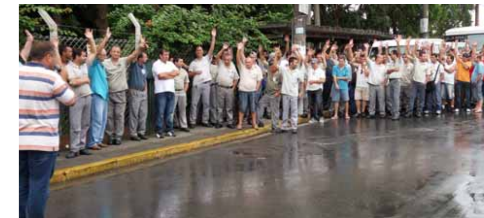
Trabalhadores durante a votação

unanimidade, todos os companheiros aceitaram a mudança de 30 minutos para uma hora de refeição.