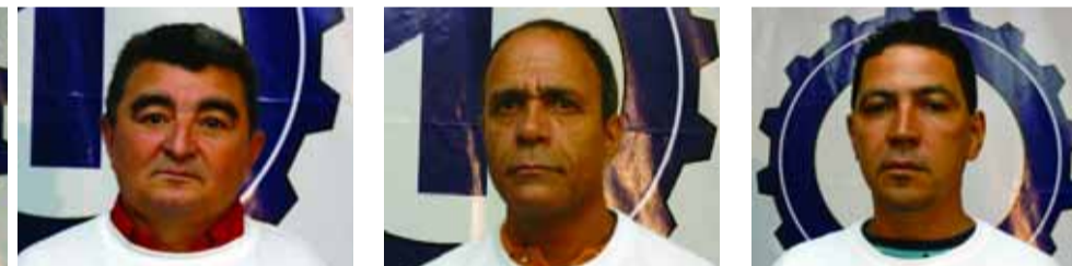
Jacó Forró Tiririca