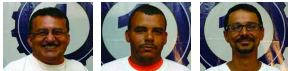
Ceará Maceió Cica