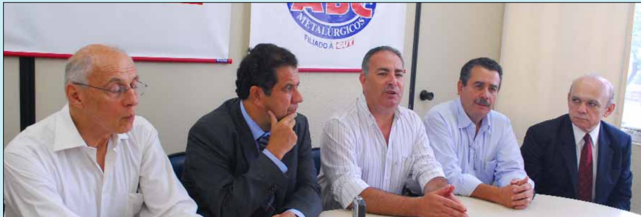
Participaram da visita Suplicy, Lupi, Nobre, Martinha e Medeiros

Conhecer a organização sindical do ABC para criar um modelo de referência que possa ser adotado em todo o País. Esse foi o objetivo da visita do ministro do Trabalho e Emprego - MTE, Carlos Lupi, na região, no dia 11 de janeiro.