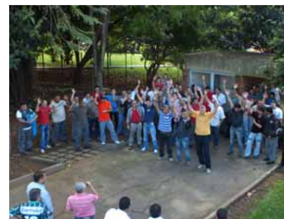
Trabalhadores em estado de greve