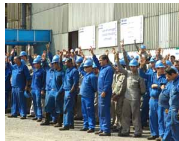
Assembleia aprovou novo turno

A partir do dia 3 de novembro, os trabalhadores da Metasa têm a opção de iniciar a jornada em novo turno: