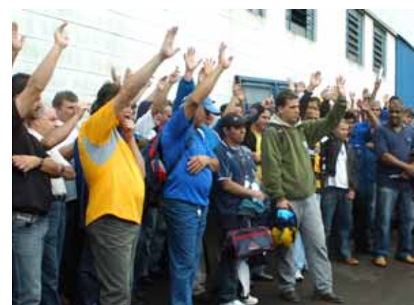
Companheiros estão descontentes com o valor e continuam mobilizados

Descontentes com a proposta da PLR oferecida pela Gaspec, os trabalhadores rejeitaram por unanimidade em