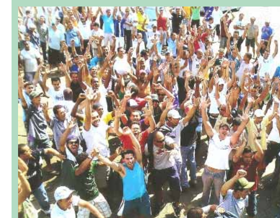
Companheiros em greve

Os trabalhadores da Tupy, maior fábrica do setor de fundição do Estado de São Paulo, entraram em greve por tempo indeterminado nesta quarta, dia 4 de novembro. Além do reajuste salarial, os companheiros exigem a melhora do plano de saúde que foi trocado no começo do mês e não inclui os principais hospitais da região. Até o fechamento da edição a empresa e os trabalhadores não haviam chegado a um acordo.