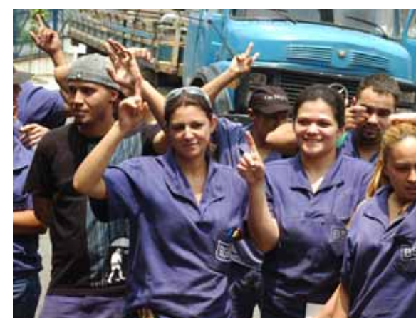
Trabalhadores conquistaram reajuste de 30% no vale alimentação

No dia 28 de outubro, os trabalhadores da BSB Rolamentos aprovaram por unanimidade o reajuste de 30% no vale alimentação, negociado pelo Sindicato com a empresa. Durante a assembleia foi discutida a viabilidade de futuramente ser implantado na empresa um restaurante ou serviço de refeição