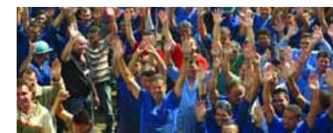
Trabalhadores da Tupy