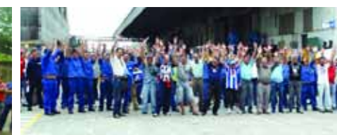
Trabalhadores da Eluma Capuava

Pressão da Nohall revolta trabalhadores - Os trabalhadores da Nohall, empresa terceirizada da Magneti Marelli, foram até ameaçados para trabalhar no dia 25 de outubro, causando indignação geral. Caso a atitude se repita, o Sindicato tomará ações mais firmes contra a empresa.