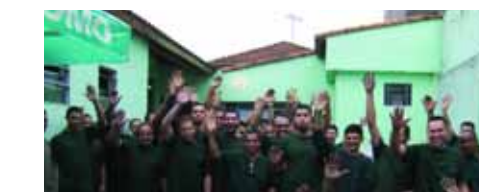
Assembleia na Cavour

Assembleia: dia 19 de outubro Pagamento: duas parcelas, nos dias 20 de outubro e 20 e fevereiro de 2010