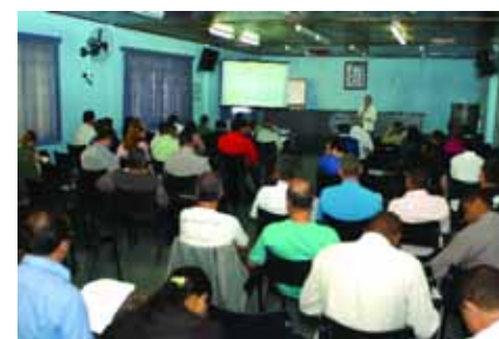
Curso realizado no Sindicato Gomes.