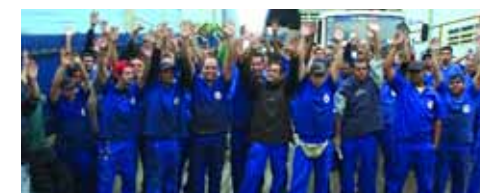
Trabalhadores da JEA