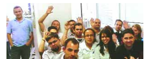
Assembleia na Arp Frio

Pagamento: duas parcelas, a primeira no dia 4 de novembro e a segunda no dia 4 de dezembro