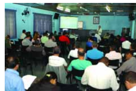
Curso realizado no Sindicato Gomes.