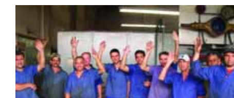
Assembleia na Mec. Bonfim

Assembleia: dia 23 de outubro Pagamento: parcela única no dia 17 de novembro