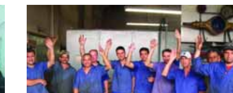
Assembleia na Mec. Bonfim

Assembleia: dia 23 de outubro Pagamento: parcela única no dia 17 de novembro