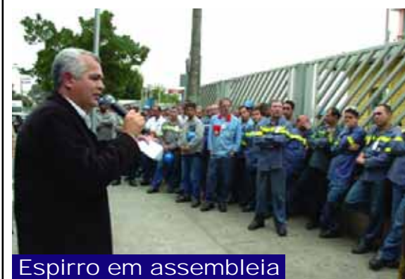
Espirro em assembleia

A organização e mobilização dos trabalhadores provou que quem luta conquista.