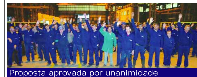
Proposta aprovada por unanimidade

no dia 31 de julho e a segunda no dia 28 de fevereiro de 2010.