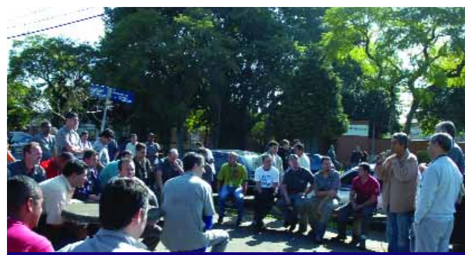
Jacaré na assembleia

quências da crise e o andamento das negociações da PLR. Nesta terça, dia 30, houve uma reunião entre o Sindicato e a empresa, onde a empresa apresentou uma proposta que será levada aos trabalhadores em assembleia no dia 2/7, às 14h.