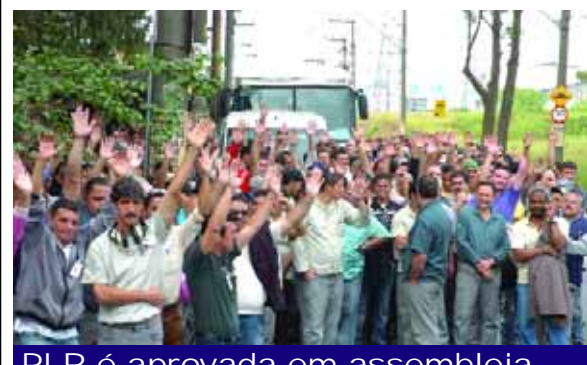
PLR é aprovada em assembleia

Em assembleia dia 24 de junho, os trabalhadores da TRW aprovaram a proposta da PLR.