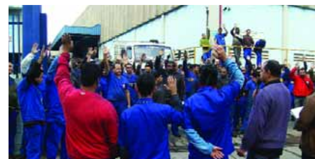
Companheiros na assembleia

será paga no dia 20 de dia 20 de junho e a segunda dezembro.