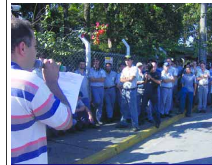
Sapão em assembleia na TRW

O Sindicato firmou convênio com a Caixa Econômica Federal e está pleiteando junto à TRW a implantação do mesmo na empresa, com o intuito de oferecer novos produtos aos trabalhadores: