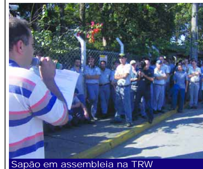
Sapão em assembleia na TRW

O Sindicato firmou convênio com a Caixa Econômica Federal e está pleiteando junto à TRW a implantação do mesmo na empresa, com o intuito de oferecer novos produtos aos trabalhadores: