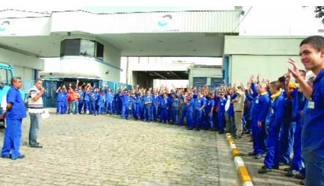
Aprovação dos companheiros

Na quinta-feira, dia 16 de abril, foi realizada uma assembleia na Borlem, às 14h30, com os trabalhadores do primeiro e segundo turno.