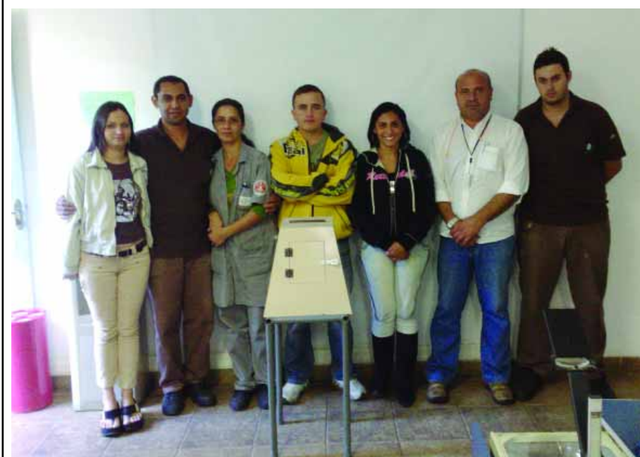
Eleição na GT do Brasil

No dia 16 de abril, foram eleitos na GT do Brasil os novos integrantes da Cipa - gestão 2009.