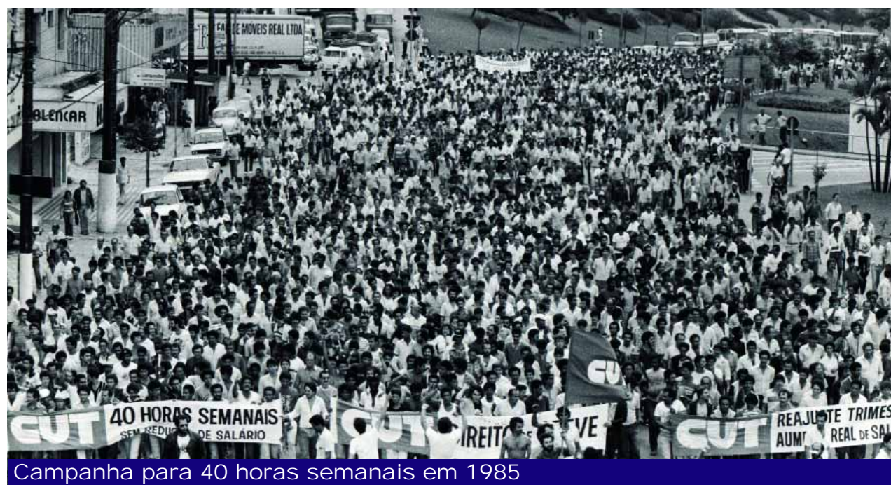
Campanha para 40 horas semanais em 1985

Participamos da conquista das 200 milhas submarinas, de todas as lutas contra a carestia e fomos para a rua nos manifestar pela anistia ampla, geral e irrestrita. Emendamos com o movimento das "Diretas já", e, quando chegou a hora, estávamos na primeira fila para apoiar o Plano Real e o fim