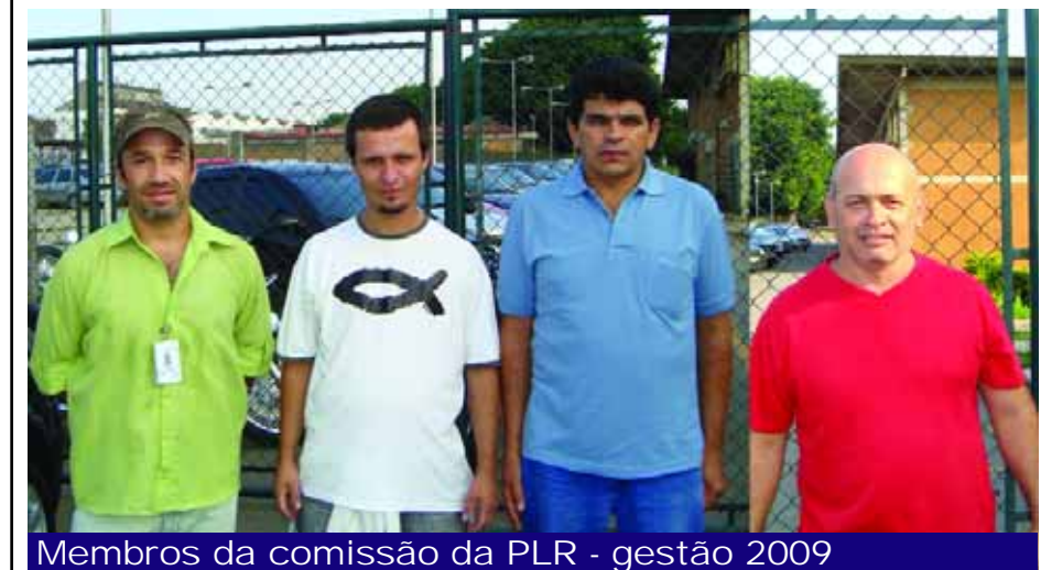
Membros da comissão da PLR - gestão 2009

Nos dias 6 e 7 de abril foi feita a eleição da comissão da PLR na Philips.