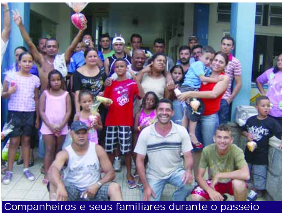
Companheiros e seus familiares durante o passeio

No dia 5 de abril, o Sindicato realizou uma excursão com os trabalhadores e seus familiares da Plasmetel para a nossa Colônia de Férias na Praia Grande.