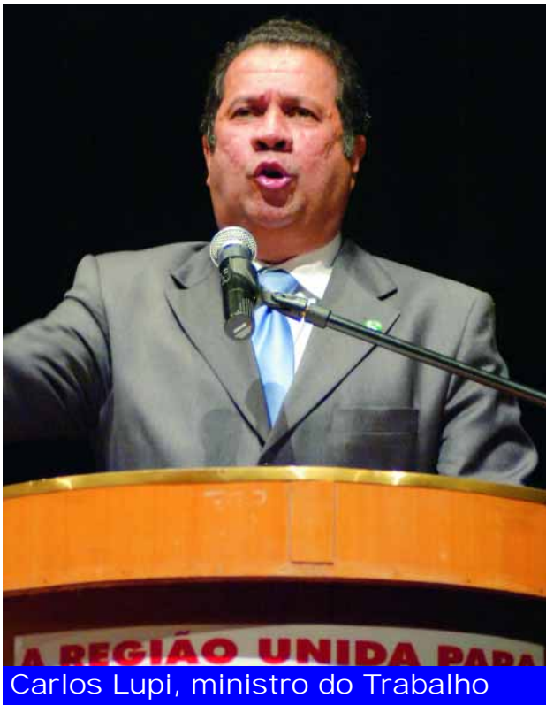
Carlos Lupi, ministro do Trabalho