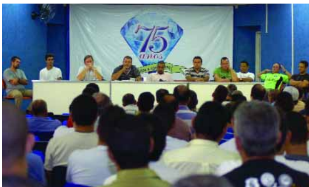
Assembleia na sede do Sindicato

Após esclarecimento de todos os detalhes aos trabalhadores, ficou agendada uma assembleia com todos os trabalhadores dos turnos 6x2 no próximo domingo, dia 22 de março, às 7h da