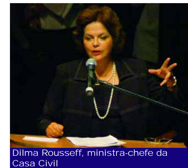
Dilma Rousseff, ministra-chefe da Casa Civil