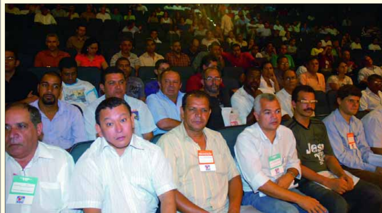
Seminário atraiu centenas de participantes do Grande ABC

O Grande ABC afirma que a crise será superada com a valorização da negociação, do trabalho, da produção, das pessoas e da cidadania, tendo como valores fundamentais a pluralidade, o respeito à pessoa humana e à democracia.