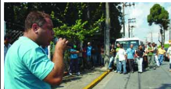
Sapão em assembleia na TRW

19/03, por tempo indeterminado até que a empresa reveja sua posição com relação as demissões.