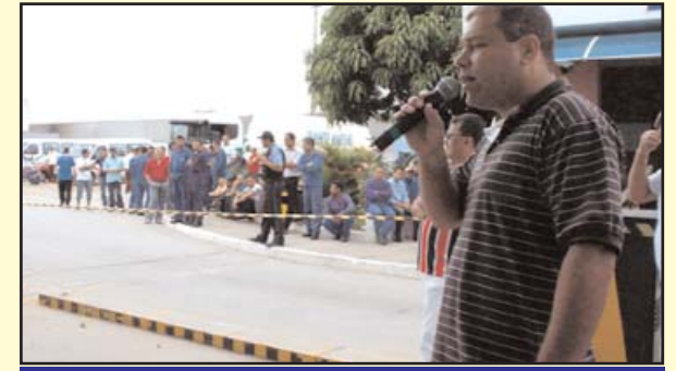
Sapão em assembleia na Eluma

O Sindicato realizou assembleia com os trabalhadores da Eluma Utinga no dia 28 de janeiro. Na ocasião, foi informado aos trabalhadores sobre a entrega da nova carteira de associados. O Sindicato aproveitou o momento para criticar o comportamento de alguns supervisores que não deram a devida importância à SIPAT (Semana Interna de Prevenção a Acidentes no Trabalho) não liberando os trabalhadores para assistirem às palestras. Tam-