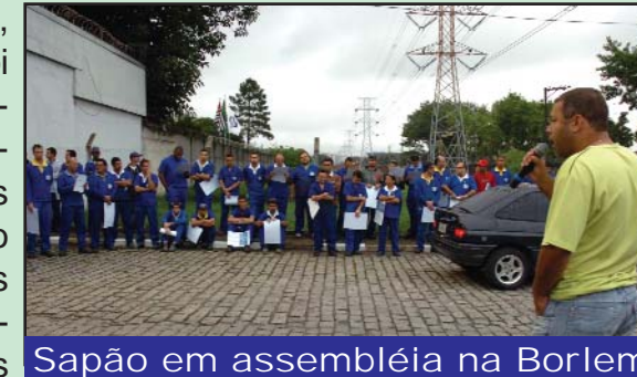
Sapão em assembleia na Borlem

Na última sexta-feira, dia 25 de janeiro, foi realizada uma assembleia na Borlem Alumínio para informar aos trabalhadores sobre o fechamento das metas da PLR de 2007. Infelizmente, nem todas