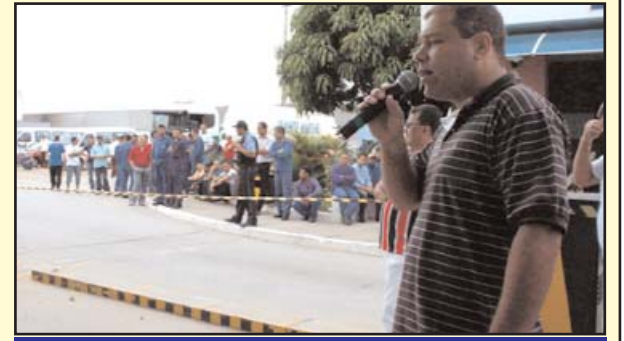
Sapão em assembleia na Eluma

O Sindicato realizou assembleia com os trabalhadores da Eluma Utinga no dia 28 de janeiro. Na ocasião, foi informado aos trabalhadores sobre a entrega da nova carteira de associados. O