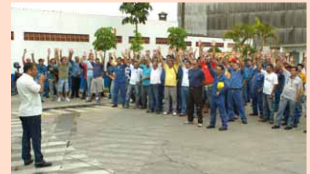
Eluma Capuava: aprovação da proposta negociada entre Sindicato e empresa