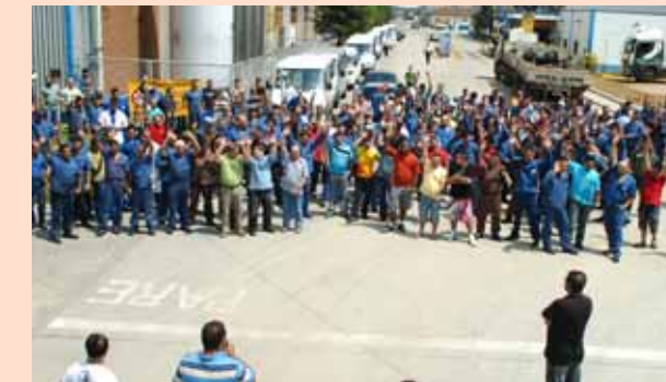
Companheiros da Eluma Utinga em assembleia realizada no dia 10/11.

Os trabalhadores da Eluma, unidades Capuava e Utinga, que discutem há meses com a empresa a campanha salarial, conquistaram um reajuste salarial de 7% e R$ 300 de abono. O acordo foi aprovado em assembleias nos dias 9 e 10 de novembro, respectivamente.