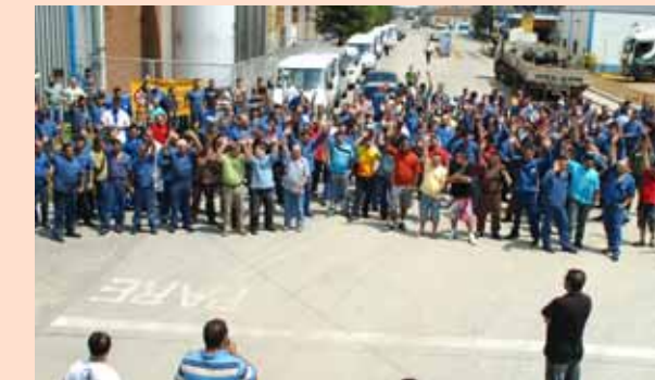
Companheiros da Eluma Utinga em assembleia realizada no dia 10/11.

Os trabalhadores da Eluma, unidades Capuava e Utinga, que discutem há meses com a empresa a campanha salarial, conquistaram um reajuste salarial de 7% e R$ 300 de abono. O acordo foi aprovado em assembleias nos dias 9 e 10 de novembro, respectivamente.