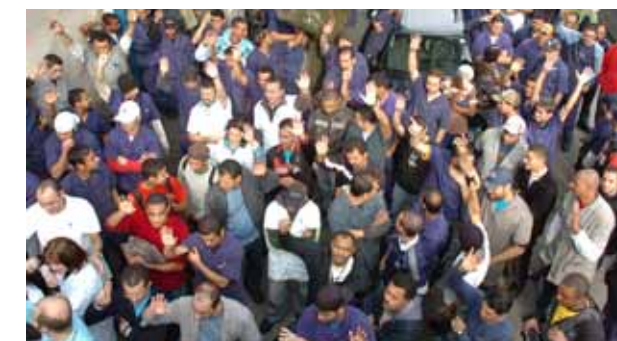
Trabalhadores da Quasar votam proposta que conquistaram após greve

Os trabalhadores da Quasar cruzaram os braços no dia 6 de novembro por uma hora e meia para reivindicar aumento salarial. A mobilização demonstrada pelos companheiros deu resultado. A empresa apresentou a seguinte proposta que foi