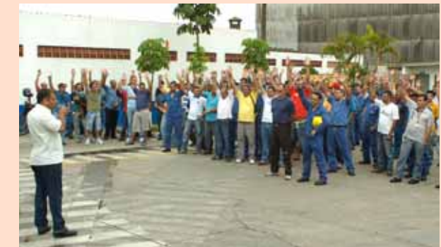
Eluma Capuava: aprovação da proposta negociada entre Sindicato e empresa